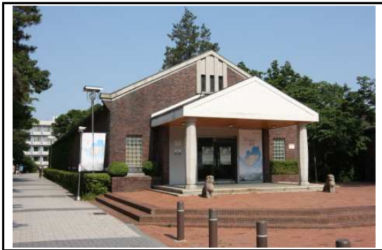
< 박물관 전경 >

서울시립대학교 박물관은 소중한 문화유산을 수집·전시하여 학생들의 교육활동을 지원하고, 시민들을 위한 문화공간으로 기능하기 위하여, 1984년 9월 4일에 개관하였다. 특히 서울시립대학교 박물관은 근현대 전문 박물관으로서 서울의 도시화 과정을 보여주는 자료의 수집과 전시를 전문으로 한다. 서울의 역사와 문화를 담은 특별전 개최, 조사연구, 유물수집 등을 통하여 학생 및 시민들에게 수준 높은 문화 서비스를 제공하고 있다.