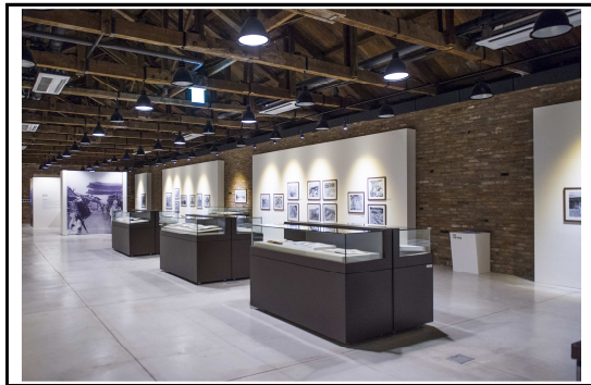
< 박물관 전시실 >