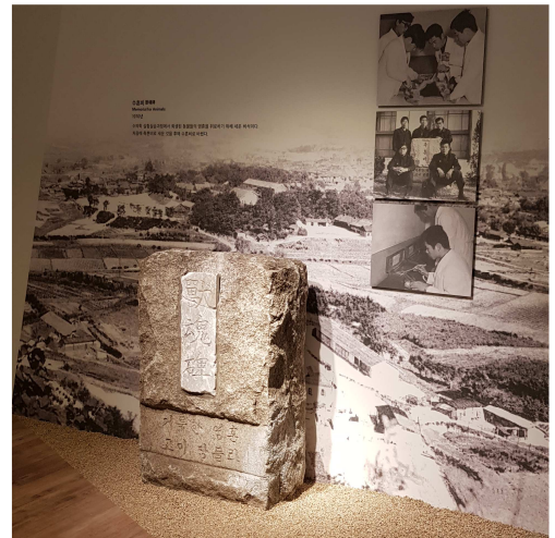
<역사관 수훈비 전시>