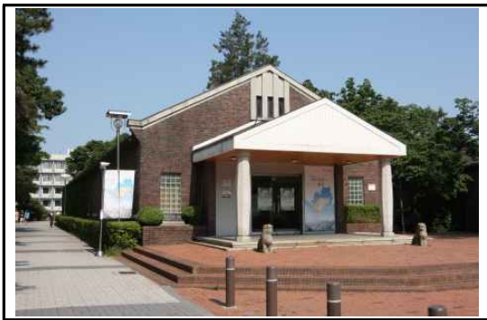
< 박물관 전경 >

서울시립대학교 박물관은 소중한 문화유산을 수집·전시하여 학생들의 교육활동을 지원하고, 시민들을 위한 문화공간으로 기능하기 위하여, 1984년 9월 4일에 개관하였다. 특히 서울시립대학교 박물관은 근현대 전문 박물관으로서 서울의 도시화 과정을 보여주는 자료의 수집과 전시를 전문으로 한다. 서울의 역사와 문화를 담은 특별전 개최, 조사연구, 유물수집 등을 통하여 학생 및 시민들에게 수준 높은 문화 서비스를 제공하고 있다.