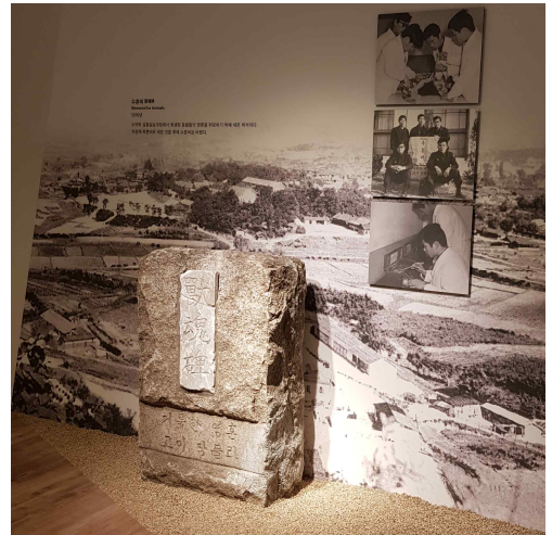
<역사관 수훈비 전시>